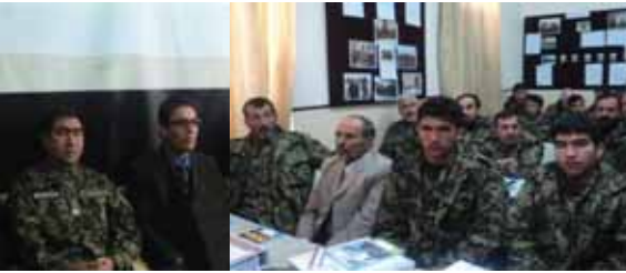
چهاردهمین دور آموزش تخصصی و مسلکی مفتشین اردوی ملی و پولیس ملی به منظور رشد و ارتقاء ظرفیت، شفافیت و حساسیتهای بهتر مسوولین اردوی ملی و پولیس ملی دایر گردید.

ظرفیت های مسلکی اکتشاف و توانمندی های نیروهای امنیتی و آژادی عمل در وظیفه برای مفتشین در مبارزه با فساد اداری و ایجاد شفافیت و حساسیتهای یک گام مهم و ارزنده خوانند بعداً رئیس تفتیش ستردرستیز گفت: ما مسوولیت بزرگ را پیش رو داریم که برای بهبود بروسه شفافیت و حساسیتهای و پیشبرد وظایف کاری مفتشین از هیچ گونه سعی و تلاش دریغ ننماییم، تا مفتشین با جرئت و جسارت وظایف خویش را انجام دهند، که تدویر چنین کورس ها به خاطر کسب دانش مسلکی و ارتقای سطح دانش مسوولان تفتیش در پیشبرد امورات یک ضرورت جدی می باشد.